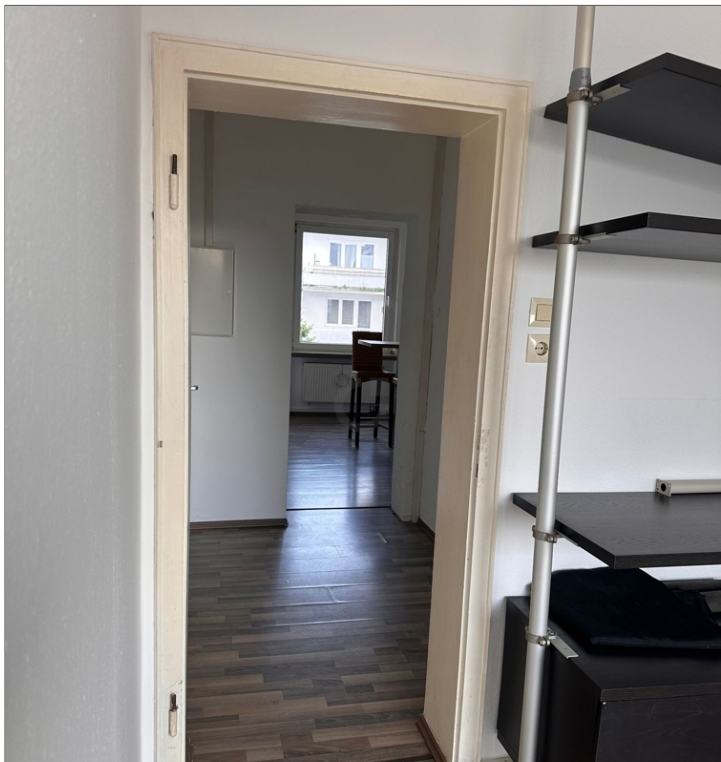
Blick aus dem Wohnraum in den Flur