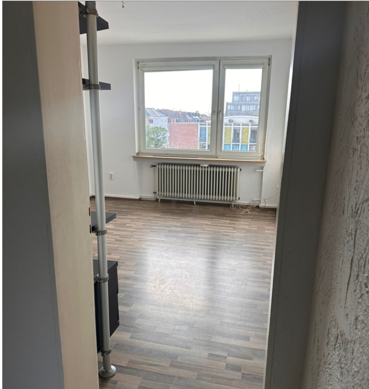
Blick in den Wohn-Schlafrum