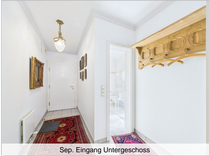
Sep. Eingang Untergeschoss