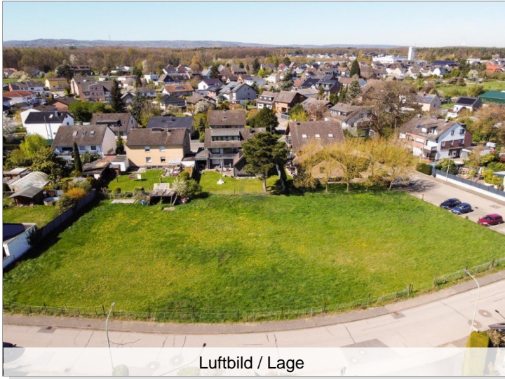
Luftbild / Lage