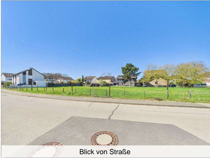
Blick von Straße