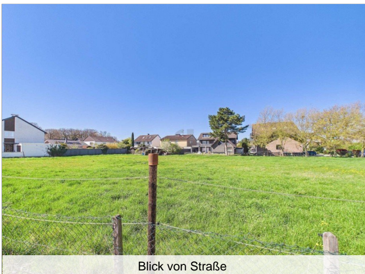
Blick von Straße