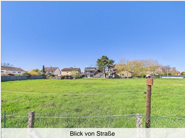
Blick von Straße