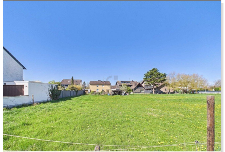
Blick von Straße