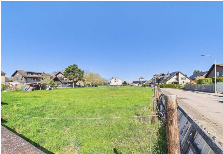
Blick von Straße