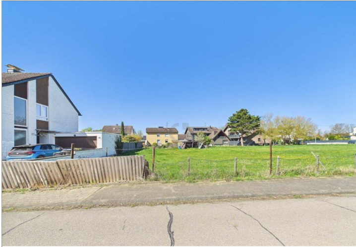
Blick von Straße