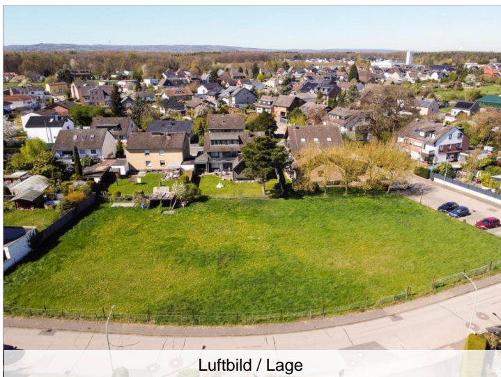
Luftbild / Lage