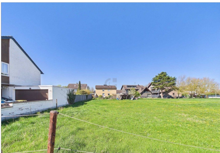
Blick von Straße