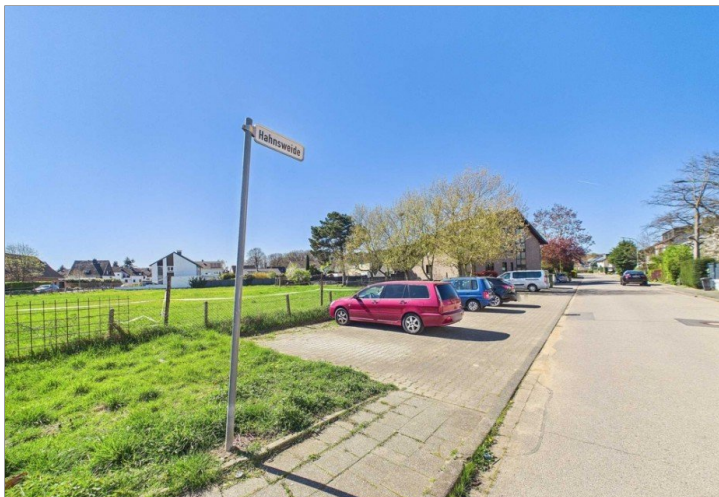
Blick von Straße