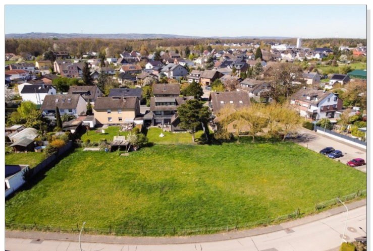
Luftbild / Lage