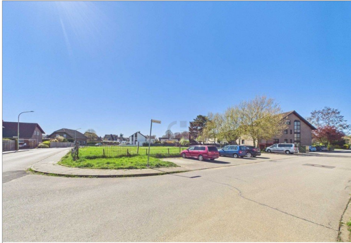
Blick von Straße