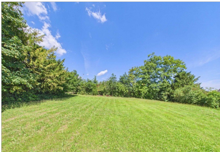
CBlick aufs Grundstück