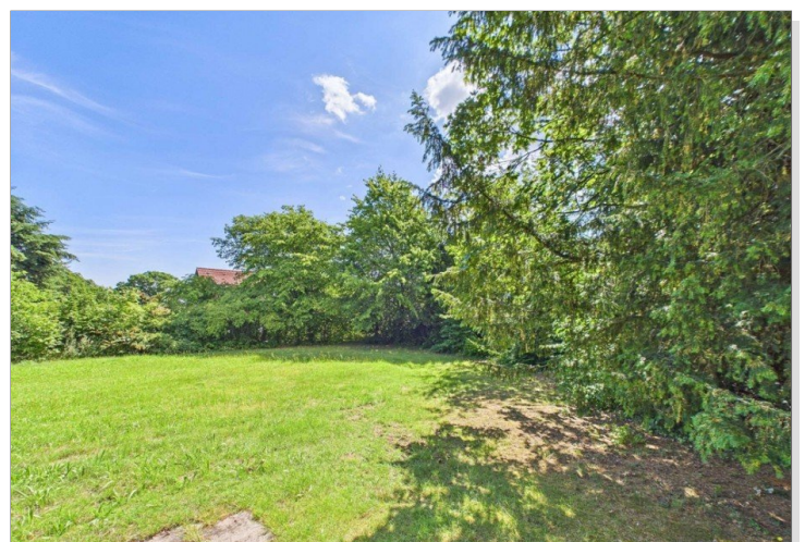
Blick aufs Grundstück