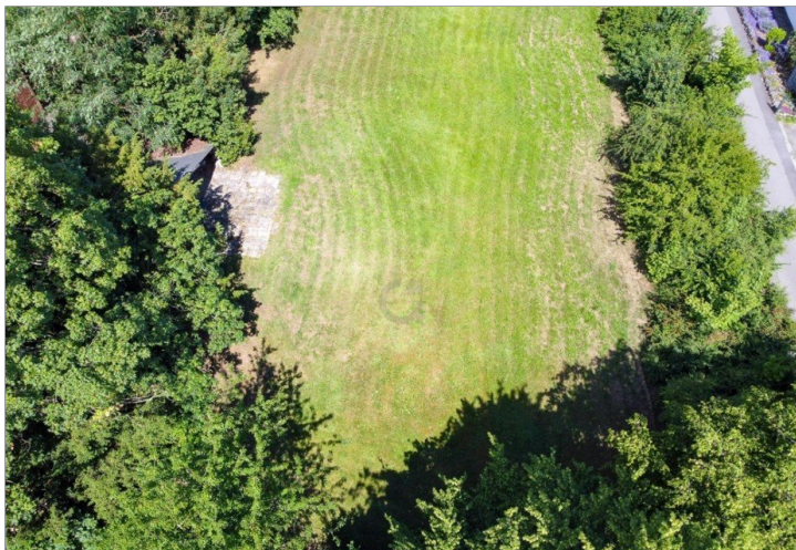
Luftbild hinterer Teil