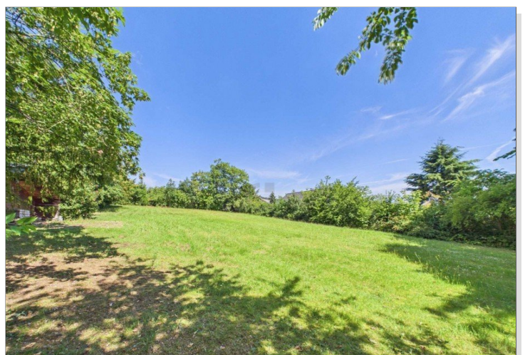
Blick aufs Grundstück