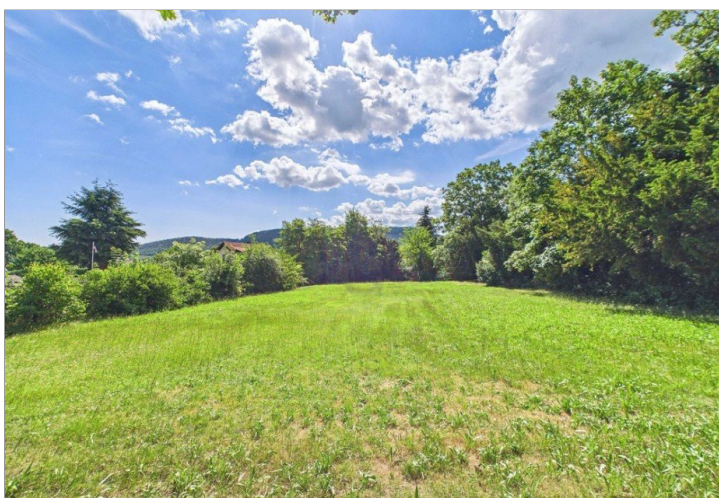
Blick aufs Grundstück