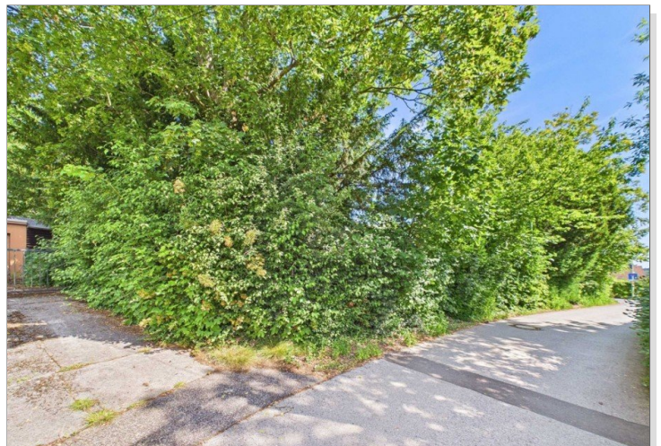
Blick auf Grundstück von hinten