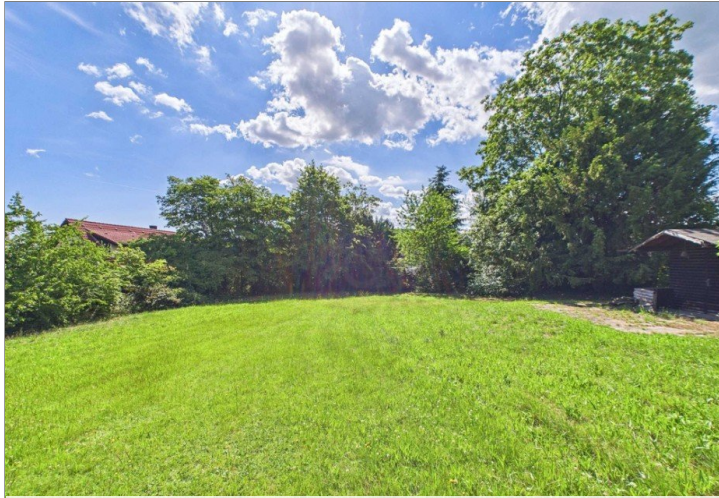
Blick aufs Grundstück