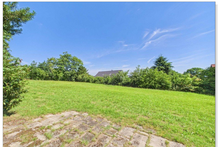
Blick aufs Grundstück