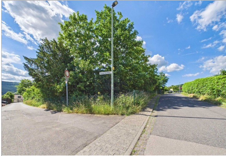
Zufahrt von Hauptstraße