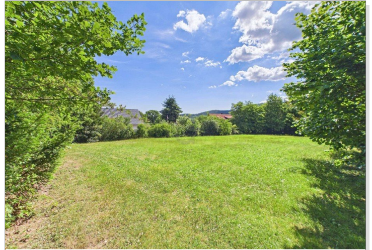
Blick aufs Grundstück