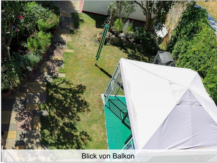
Blick von Balkon